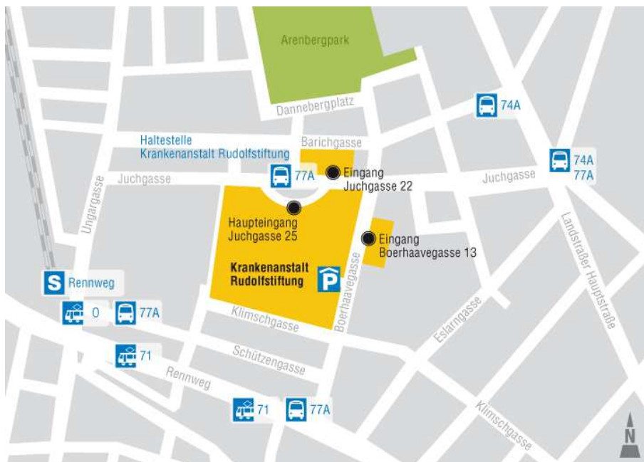
Grafik: KAV / blickdicht